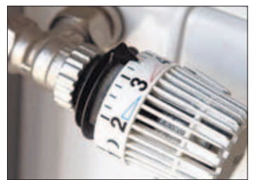
Deutschland hat vorgesorgt: Die Heizungen laufen weiter.

Die Einschränkung russischer Gaslieferungen hat Westeuropa kalt erwischt. Russland ist für Deutschland mit einem Lieferanteil von 37 Prozent der wichtigste Erdgaslieferant. Auf den nächsten Plätzen folgen Norwegen mit 26 und die Niederlande mit 18 Prozent. Nur zu 15 Prozent fördert Deutschland sein Erdgas selbst, ei-