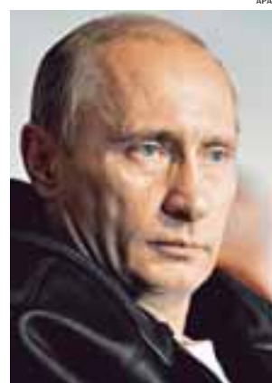
Wer wird Wladimir Putin als Präsident nachfolgen?

„Neben der Verfassung gibt es viel Wildwuchs“, sagt Nußberger. Putin habe etwa die Präsidialadministration mit den selben Funktionen wie die Ministerien ausgestattet. Grundsätzlich gelte: „Was dem Präsidenten nicht verboten ist, ist dem Präsidenten erlaubt“.