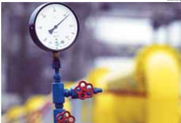
Das IPO von zehn Prozent der rumänischen Transgaz stiess im Land auf heftigen Widerhall

Insgesamt betrug das Volumen des Börsengangs mit 1,177.384 Aktien schliesslich 64,34 Millionen €. Von den institutionellen Investoren zeichnete der Financial Investment Fund (SIF) Oltenia mit 706.430 Aktien um 39 Millionen € das grösste Paket. Die SIF Moldova erhielt 90.000 Aktien um 3,5 Millionen €. Die Mehrheit der Transgaz bleibt im Staatseigentum. (asa)