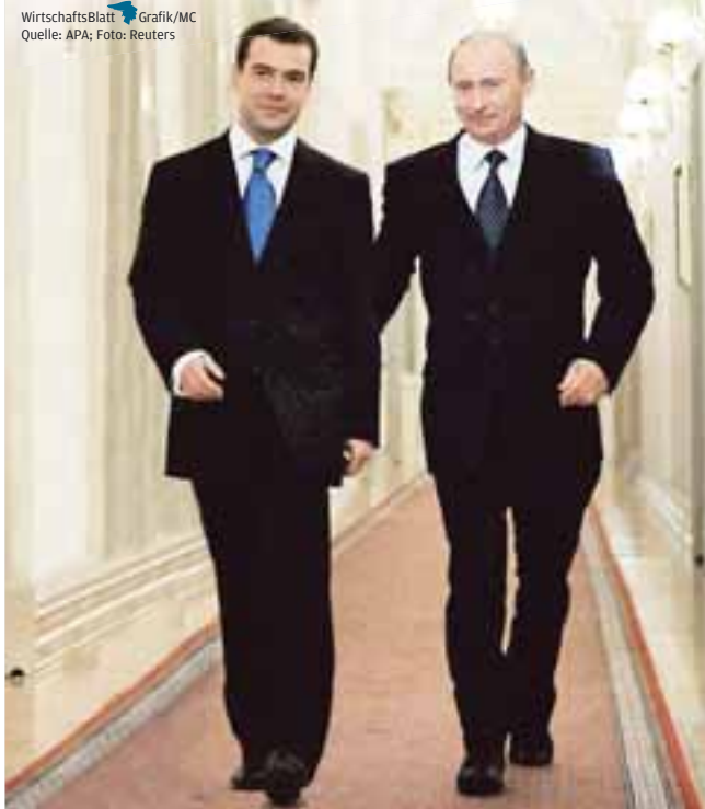
Das politische System ist auf den Präsidenten zugeschnitten. Putin (re.) hätte unter Medwedew (li.) nicht viel zu melden