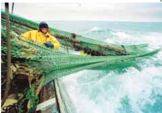
Slowenien übernimmt den EU-Vorsitz und will die offenen Fragen mit Kroatien angehen, darunter die Fischerei

Die SDP-Partei (Sozialisten), die ebenso wie Sanaders HDZ um Partner ringt, vermutet, dass Sanader die neuen Brüssel-Warnungen selbst initiiert hat, um HSS zum Einlenken zu zwingen. (tam)